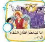
الله يتحضر أعنا في السماء إلى الأبد.